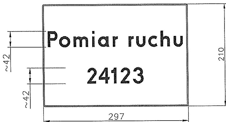
a. Wzór tabliczki do oznakowania stanowiska pomiaru ręcznego bezpośredniego