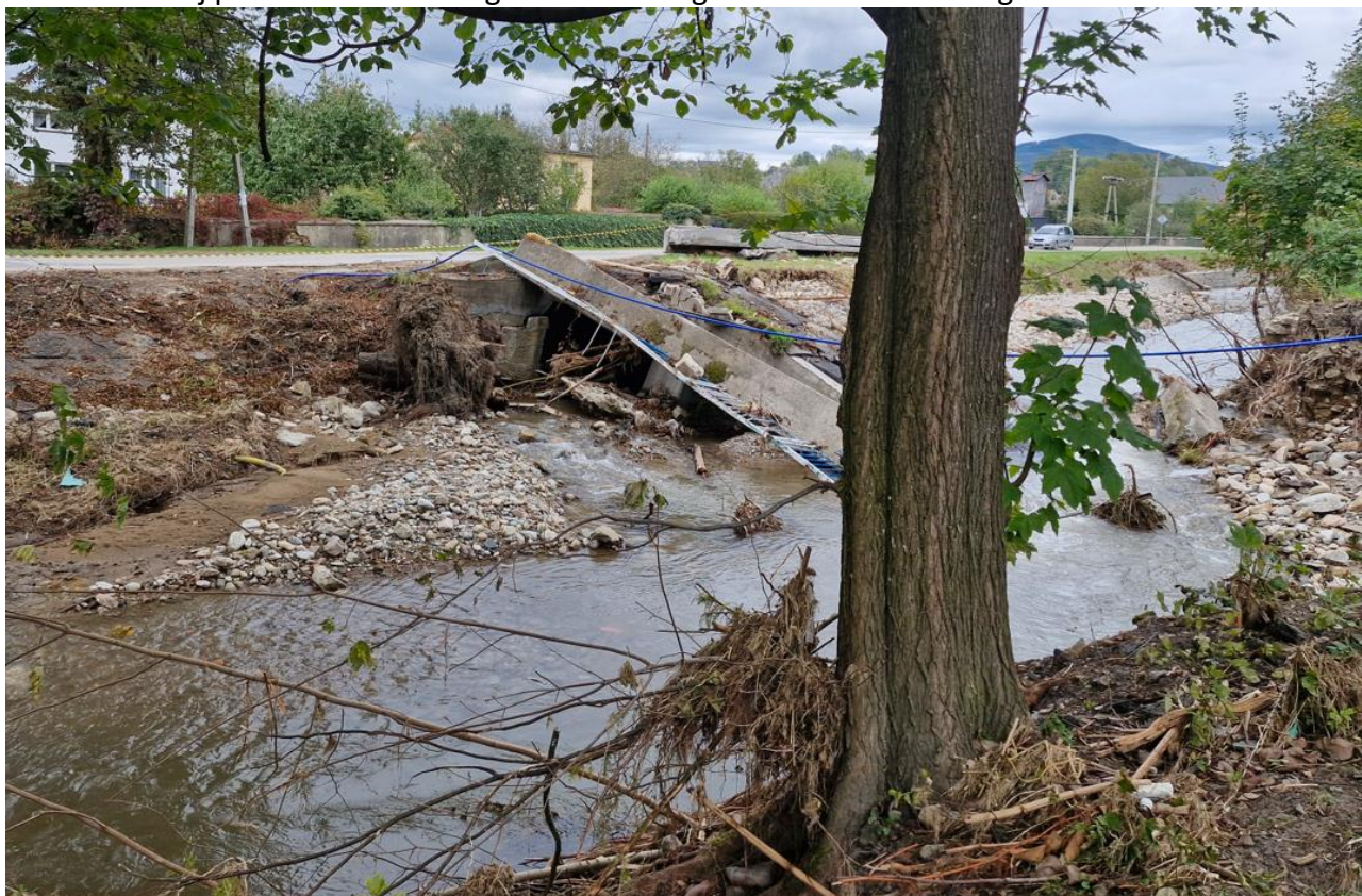
Rys. 5.1 Widok zniszczonego obiektu stałego

Poniżej przedstawiono fotografie aktualnego stanu obiektu stałego.