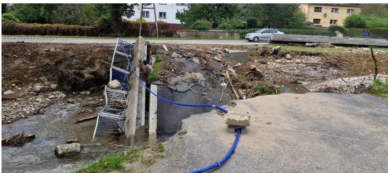
Rys. 1.2 Widok zniszczonego obiektu stałego w terenie

Celem niniejszego opracowania jest sporządzenie projektu budowlanego podpór pod most tymczasowy nad rzeką Wilczka w miejscowości Wilkanów.