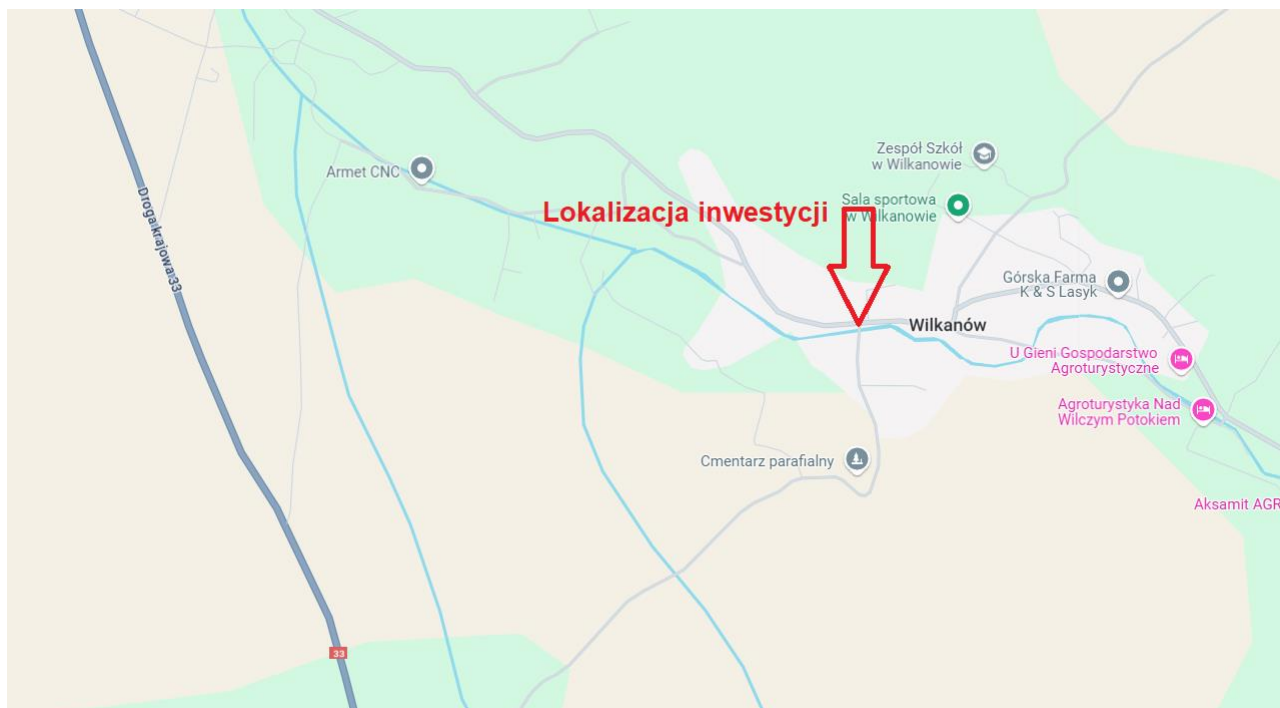
Rys. 1.1 Lokalizacja mostu

Przedmiotem opracowania jest wykonanie projektu posadowienia tymczasowego dla mostu tymczasowego DMS-65, który będzie zlokalizowany w obrębie zniszczonego w wyniku powodzi mostu na rzece Wilczka w miejscowości Wilkanów, gmina Bystrzyca Kłodzka. Podpory mostu projektują się na działkach ewidencyjnych nr 94, 90/2, 799 i 984/3 obręb 0036 Wilkanów. Na rysunku nr 1.1 przedstawiono lokalizację obiektów, a na fotografii nr 1.2 przedstawiono widok zniszczonego obiektu stałego w terenie.