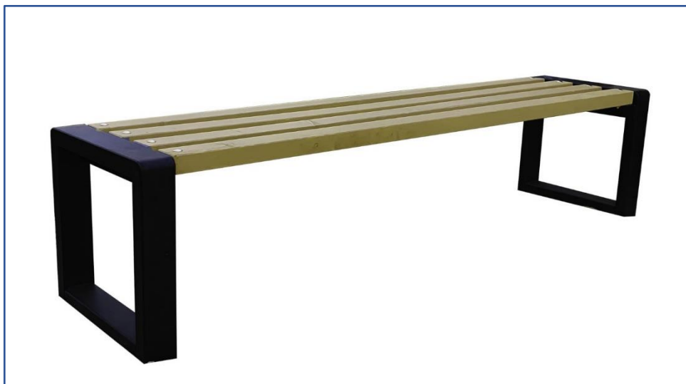
Fot. 7. Przykładowe ławki proste bez oparcia (2 zakotwienia) – widok aksonometryczny

Ławki powinny spełniać następujące parametry: odporność na warunki atmosferyczne, stelaż z kształtowników stalowych o wymiarach min. 80x40mm gr. 4mm, rama malowana proszkowo, wypełnienie z podwójnie impregnowanych desek o grubości min. 4 cm, ławki powinny być na stałe przytwierdzone do podłoża.