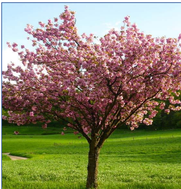
Fot. 6. Przykład nasadzenia drzew owocowych – wiśnia piłkowana Kanzan