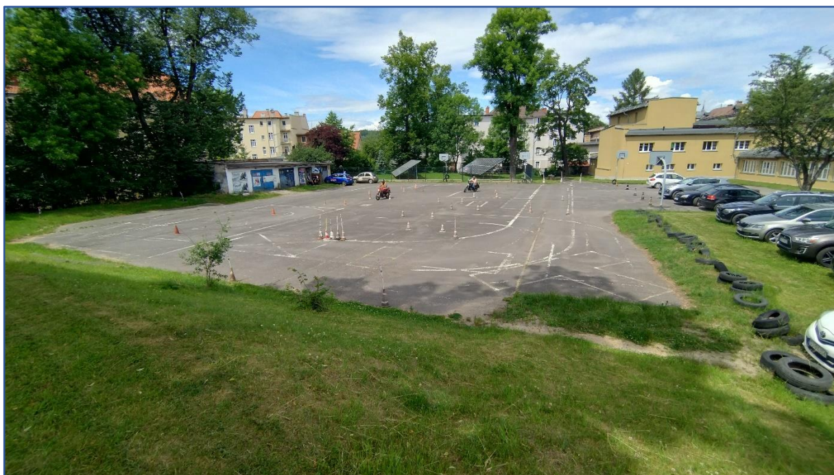
Fot. 3. Istniejący plac przeznaczony do modernizacji

Należy zwrócić szczególną uwagę na elementy odwodnienia parkingu oraz istniejącą infrastrukturę podziemną. Materiały z rozbiórki należy wywieźć oraz zutylizować zgodnie z ustawą z dnia 14 grudnia 2012 r. o odpadach (Dz.U.2023.0.1587 t.j.)