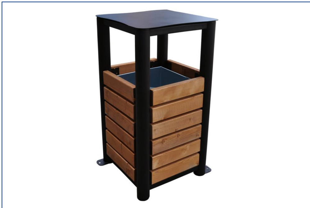
Fot. 8. Przykładowy kosz na śmieci z daszkiem (1 zakotwienie) – widok aksonometryczny

Kosz na śmieci powinien spełniać następujące parametry: odporność na warunki atmosferyczne, stelaż z kształtowników stalowych gr. 4mm malowany proszkowo, podwójnie impregnowane wypełnienie drewniane, uchylny daszek chroniący przed czynnikami atmosferycznymi, ocynkowany wkład, mocowanie do podłoża.