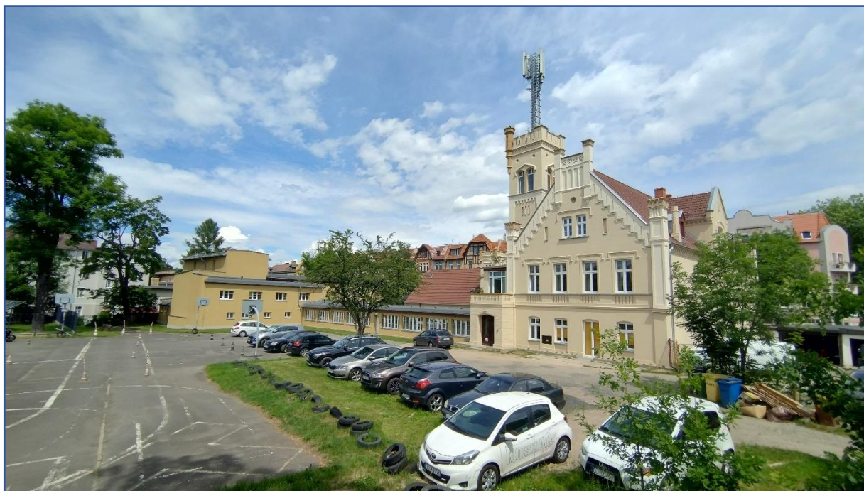
Fot. 2. Istniejące budynki oraz parking graniczące z terenem inwestycji (po lewej stronie)