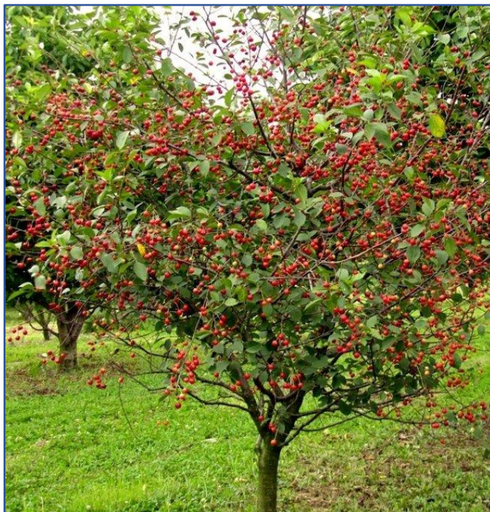
Fot. 5. Przykład nasadzenia drzew owocowych – wiśnia Piemont