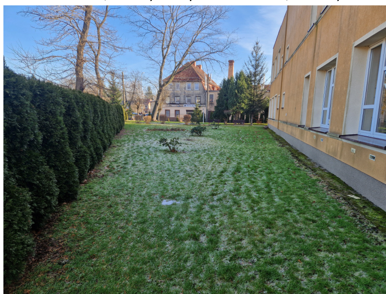
Fot3. Widok skweru, na którym ma powstać siłownia, od strony ul. Marysieńki Sobieskiej