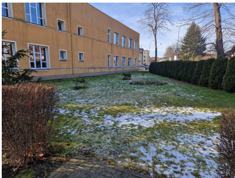
Fot2. Widok skweru, na którym ma powstać siłownia, od strony ul. Gimnazjalnej