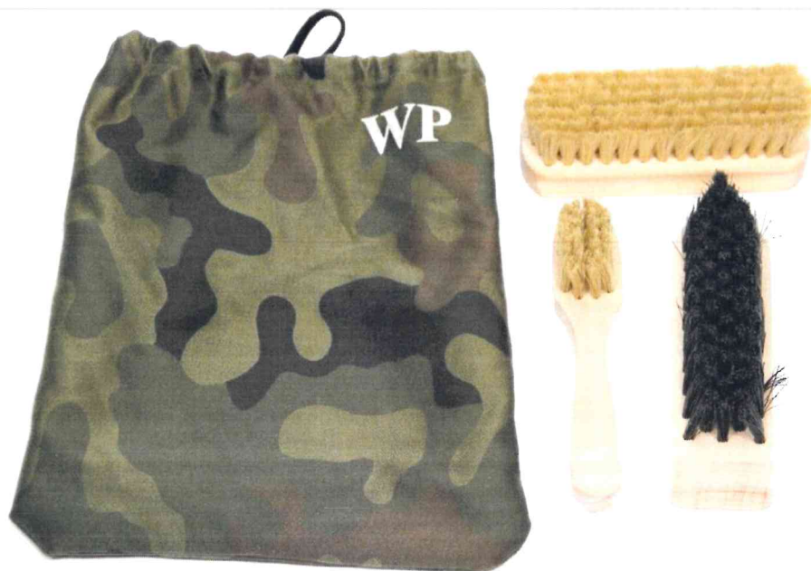
Zestaw przyborów do konserwacji obuwia - Wzór 816/MON